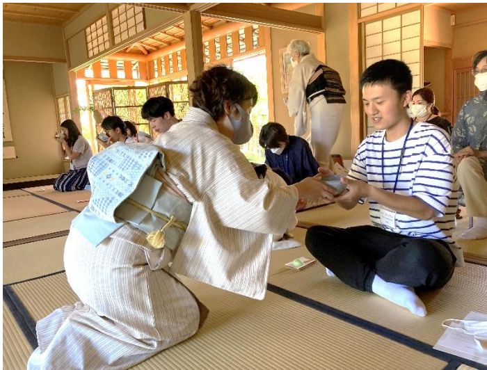
昨年の活動の様子から(茶道体験・震災津波伝承館見学)