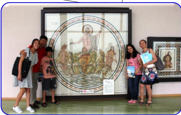
寄贈モザイク画コーナー