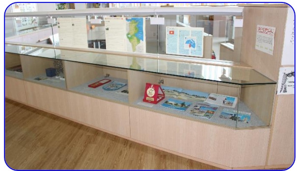
チュニジアコーナー