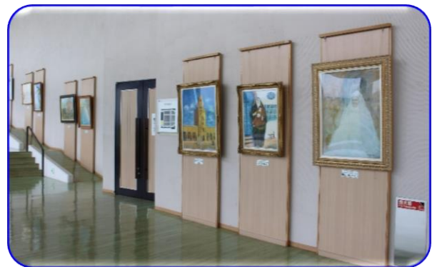
寄贈絵画コーナー